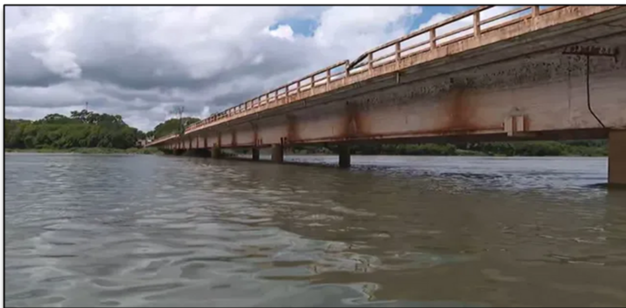
Figura 1 – Imagem da Ponte Gumercindo Penteado sobre o Rio Grande na BR-364.

O reservatório da UHE Marimbondo não pode operar no seu nível máximo normal à montante (elevação 446,30 metros) porque o tabuleiro da ponte Gumercindo Penteado seria atingido pela água, o que causaria esforços laterais na estrutura da ponte, reteria a vegetação flutuante proveniente do rio Pardo e impediria a passagem de embarcações. A ponte Gumercindo Penteado, está localizada na BR-364, sobre o rio Grande, interligando os municípios de Colômbia-SP e Planura-MG, foi construída na década de 1950 e opera sob responsabilidade do DNIT.